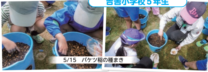
5/15 バケツ稲の種まき