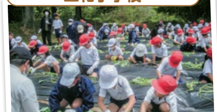
5/23 サツマイモ苗の定植