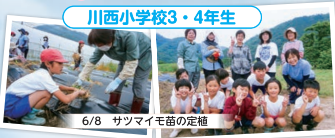
6/8 サツマイモ苗の定植