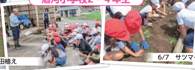
6/7 サツマイモ苗の定植