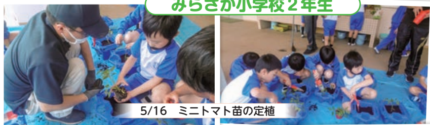
5/16 ミニトマト苗の定植