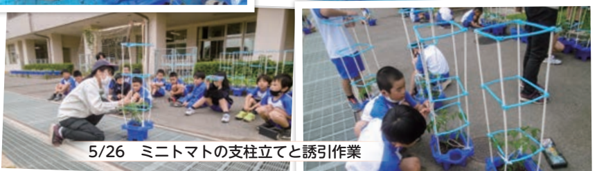
5/26 ミニトマトの支柱立てと誘引作業